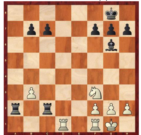
Schwarz verhindert Matt (3 Arten).