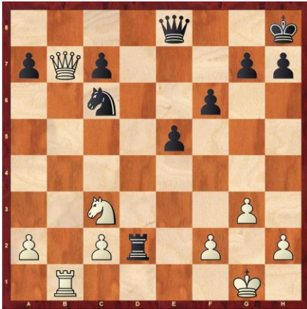
Weiß gewinnt Material. (**)