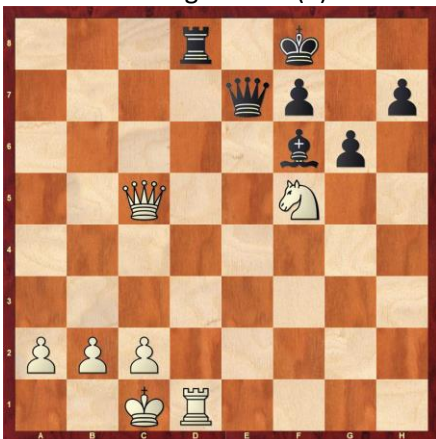
Weiß gewinnt. (*)