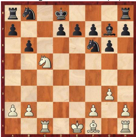
Weiß gewinnt. (*)