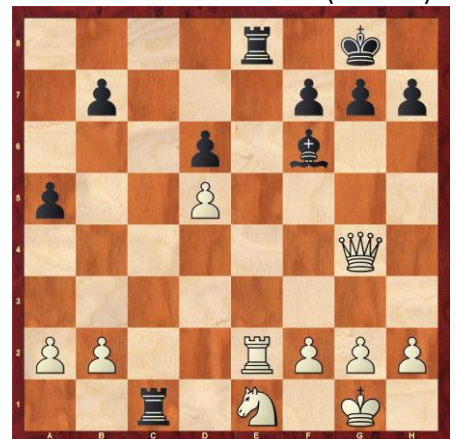
Schwarz gewinnt. (**)