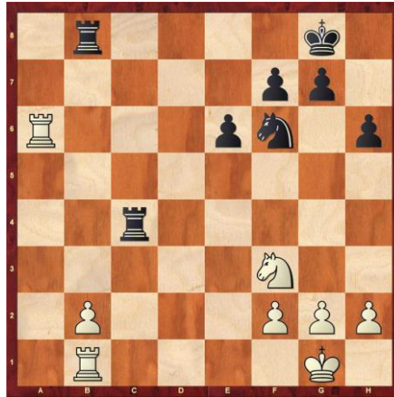
Schwarz gewinnt Material. (*)